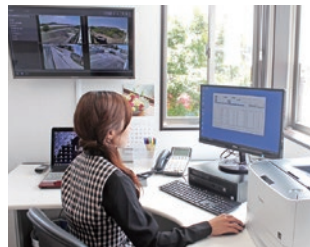
モニターシステムを備えた受付