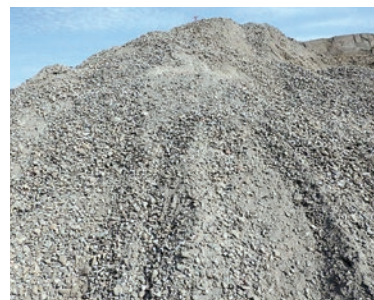
独自の工夫を施され再び建材となった「再生ズリ」

ことに成功しました。「再生ズリ」と名付けられたこの製品。粒径50〜60ミほどで一般的な再生砕石より一回り大きく、水をよく通します。用途は河川工事などの構造物の基礎材、民間の舗装工事の路盤材など幅広くすでに大牟田市や民間の発注した工事に使われています。