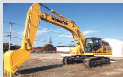
環境への負荷が少ない最新式のハイブリッド重機