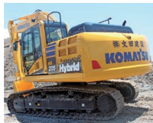
多数導入されたハイブリッド重機