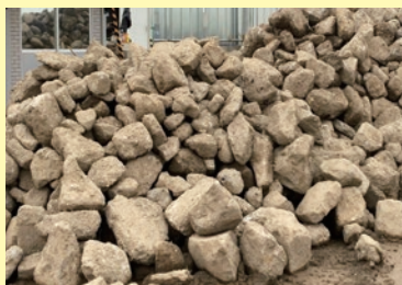
ごろごろとした岩塊が...

独自の製造工程(特許出願中)で新しい建設資材として再生することに成功。平成27年、国土交通省の地域建設業活性化支援事業のコンサルティング支援対象に選定されました。内容については、近日中にネットや冊子で公開予定です。今後も、資源循環型社会に貢献します。リフォームなどで出る石垣の石や庭石なども受け入れます(要相談)。