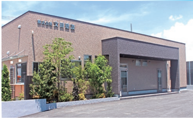
7月11日に稼働し始めたばかりの新本社屋